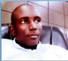
Léonce-Second, Congo Brazzaville

FORMATION EN PRESENTIEL - MANAGEMENT DES PROJETS ET PROGRAMMES HUMANITAIRES, PROMOTION 2019